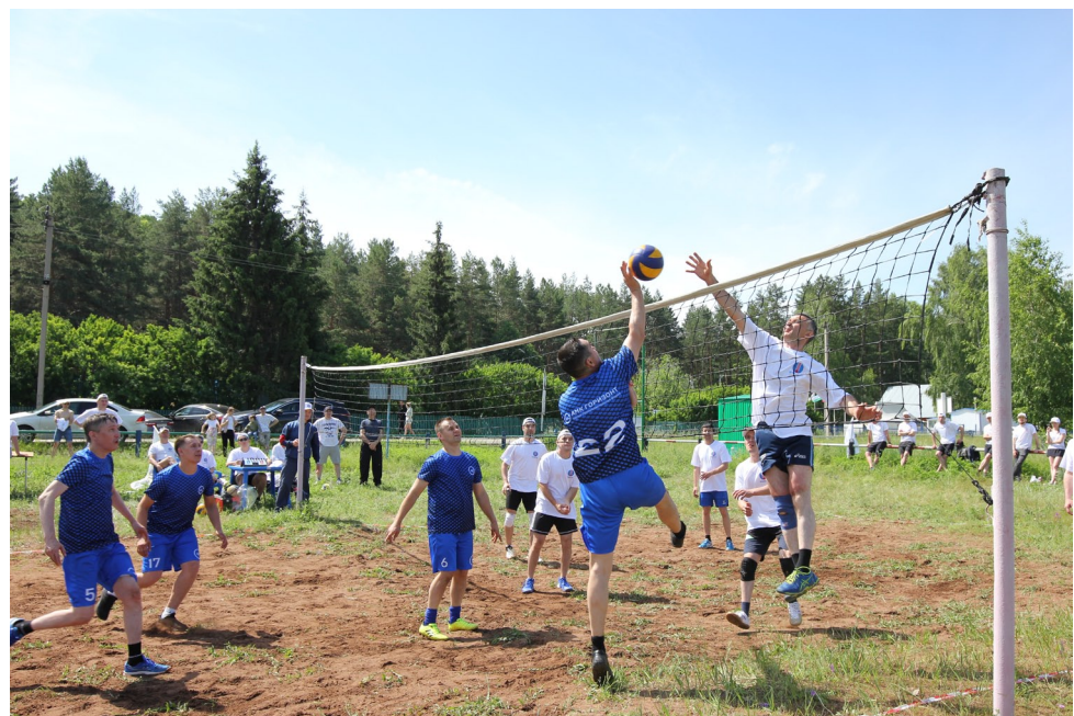
Волейбольная схватка между командами АМК «Горизонт» и ВНИИГИС была жаркой.

Не было равных команде АМК «Горизонт», которая проявила себя в комбинированной эстафете, шахматах, перетягивании каната и легкой атлетике. Лучший шахматист спартакиады — предсе-