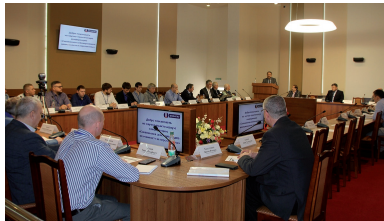
📷 Научные сотрудники обсудили возможности применения и перспективы развития скважинной сейсморазведки в модификации вертикального сейсмического профилирования.

— Конференция, безусловно, актуальна, потому что методы скважинной сейсморазведки и вертикального сейсмического профилирования востребованы во всём мире. Сложность задач, которые решаются этим методом, возрастает, поэтому и